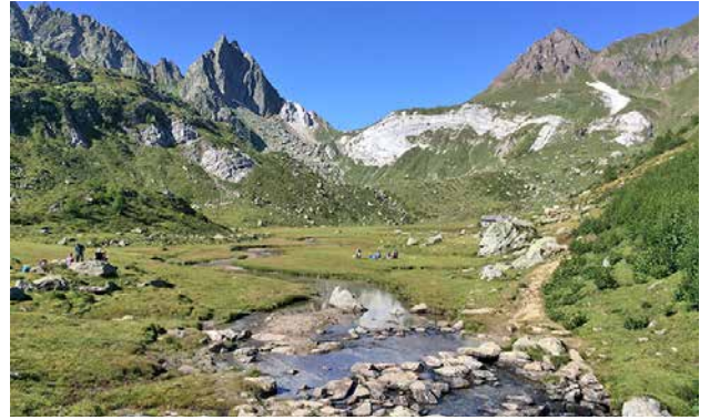
Alpe Campolungo mit Dolomit (kein Schnee)